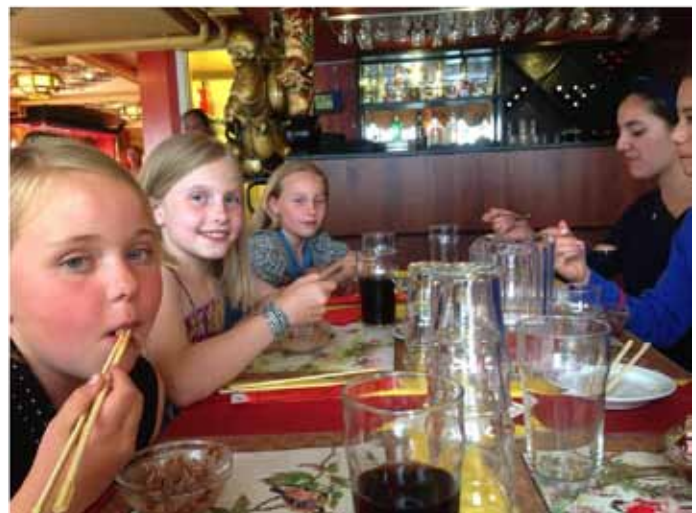
Sommerafslutning på Mongolian barbecue