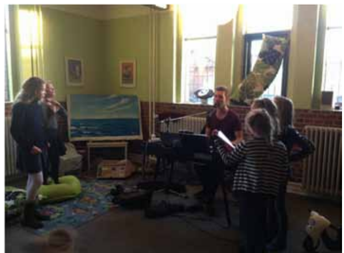
Der øves på livet løs i Århus