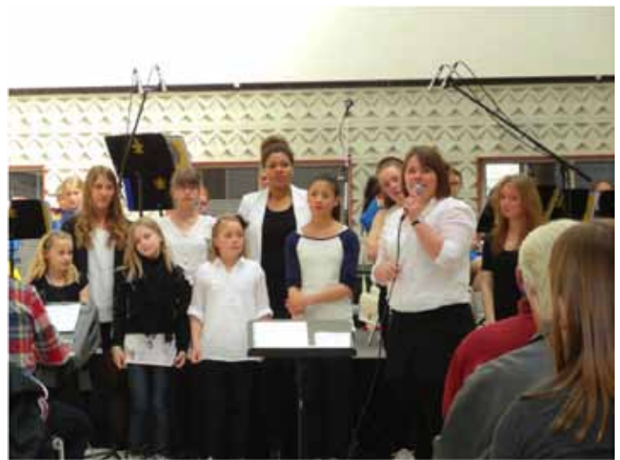
joystick synger forårskoncert sammen med Odense Pigearde